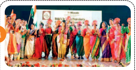
इतिहास के पन्नों से जीवंत हुई...