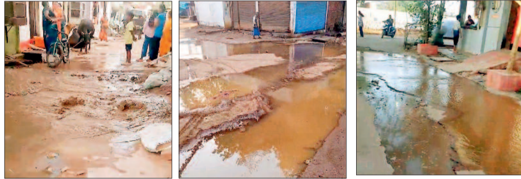
नूरी मस्जिद से लेकर निजामी चौक तक भीम नगर में भी पाइप लाइन में लीकेज से इस तरह भर रहा सड़कों पर पानी।

मिलाई नगर निगम के द्वारा सुपेला चौक में 2.17 करोड़ की लागत से बनी पानी की टंकी अष्टाचार की मेंट चढ़ गई। टंकी का निर्माण पूरा होने के बाद निगम के अधिकारियों ने इसकी चार बार टेस्टिंग कर डाली, लेकिन हर बार पाइप लाइन में जगह-जगह लीकेज होने से जलभराव की समस्या हो पा रही है। टंकी से पानी सप्लाई शुरू नहीं होने से भीषण गर्मी में तीन वार्डों के लोग पेयजल के लिए परेशान हैं। सुपेला क्षेत्र के वार्ड क्रमांक 16 में बनाई गई पानी टंकी से आसपास के कई वार्डों में पानी सप्लाई करने की योजना थी, लेकिन हकीकत यह है कि टंकी बनने के बाद भी लोगों के घरों तक पानी नहीं पहुंच पा रहा है। रविवार को इस टंकी की चौथी बार टेस्टिंग की गई, जोकि फेल हो गई। टेस्टिंग के दौरान जगह-जगह लीकेज की समस्या देखने को मिली।