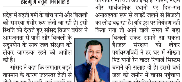
हरिभूमि न्यूज ►► मिलाई

प्रदेश में बढ़ती गर्मी के बीच पानी और बिजली की समस्या गंभीर रूप लेती जा रही है। इसी स्थिति को देखते हुए सांसद विजय बघेल ने आमजनता से पानी और बिजली के सदुपयोग के साथ जल संरक्षण को लेकर जागरूक रहने की अपील की है। सांसद ने कहा कि लगातार बढ़ते तापमान के कारण जलस्तर तेजी से नीचे जा रहा है। वहीं, कई जगहों पर टुल्लू पंपों के अवैध उपयोग से स्थिति और बिगड़ रही है। पाइपलाइन से पानी को जबरन खींचने के कारण फ्लैट और बहुमंजिला इमारतों में रहने वाले लोगों को पर्याप्त पानी नहीं मिल पा रहा है, जिससे रोजमर्रा की जरूरतें भी प्रभावित हो रही हैं। स्थानीय निवासियों के अनुसार, टुल्लू पंपों के इस्तेमाल से जल वितरण असंतुलित हो रहा है। कुछ घरों में जरूरत से ज्यादा पानी पहुंच रहा है, जबकि कई परिवारों को पानी के लिए जूझना पड़ रहा है। इससे मोहल्लों में असंतोष भी बढ़ने लगा है। बिजली के उपयोग