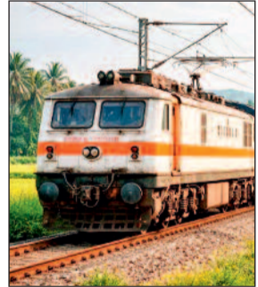
हरिभूमि न्यूज | मिलाई

रेलवे ने यात्रियों की सुविधा के लिए कंफर्म बर्थ की व्यवस्था ट्रेनों में किया है। ग्रीष्म काल के दौरान ट्रेनों में यात्रियों की होने वाली अतिरिक्त भीड़ को ध्यान में रखते हुये सुगम और कंफर्म बर्थ के साथ यात्रा सुविधा उपलब्ध कराया जा रहा है। उधना-सांतरागाछी-उधना के मध्य 2-2 फेरे के लिए स्पेशल ट्रेन का परिचालन किया जा रहा है। ट्रेन 09053 उधना-सांतरागाछी स्पेशल ट्रेन का परिचालन उधना से 20- 25 अप्रैल को किया जाएगा। ट्रेन 09054 सांतरागाछी-उधना स्पेशल ट्रेन का परिचालन सांतरागाछी से 22- 27 अप्रैल को किया जाएगा। ट्रेन का वाणिज्य ठहराव दक्षिण पूर्व मध्य रेलवे के गोंदिया, दुर्ग, रायपुर एवं बिलासपुर स्टेशनों में दिया गया है। ट्रेन 09053 उधना-सांतरागाछी स्पेशल ट्रेन, उधना से 20 - 25 अप्रैल को 11.25 बजे रवाना होगी। मध्यवर्ती स्टेशनों से होते हुये दूसरे दिन गोंदिया आगमन 02.30 बजे, प्रस्थान 02.35 बजे, दुर्ग आगमन 05.03 बजे, प्रस्थान 05.08 बजे, रायपुर आगमन 05.43 बजे, प्रस्थान 05.48 बजे, बिलासपुर आगमन 07.30 बजे, प्रस्थान 07.40 बजे होते हुये 21.00 बजे सांतरागाछी स्टेशन पहुंचेगी।