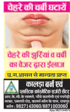
वेहरे की चर्चा घटाएँ वेहरे की सुरियां व चर्चा का वेजर द्वारा इलाज छ.ग.शासन से मान्यता प्राप्त कालड़ा बर्न एव पारितोषिक कोसैटिक सर्जरी सेंटर आर.के.सी.के.सामने, चौथे फ्लोरी, पंचपथी नाका, धरमपुरी रोड, कलस मॉल के पास, रायपुर कॉल: 9827143060/8871003060 Apy 9827143060