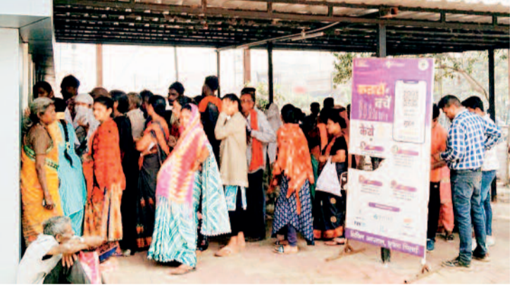
सुपेला सरकारी अस्पताल में इन दिनों बढ़ गई है मरीजों की संख्या।