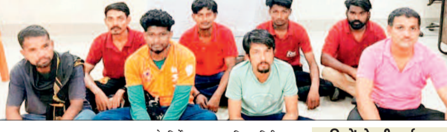
हरिभूमि न्यूज ►► मिलाई

रेलवे ने यात्रियों की सुविधा और पदार्थों की स्वच्छता, गुणवत्ता बनाए रखने का प्रयास अनिश्चित यात्रियों, अनाधिकृत वेडिंग के खिलाफ वाणिज्य विभाग, वाणिज्य विभाग ने चलाया अभियान रेलवे सुरक्षा बल के साथ संयुक्त कार्रवाई की गई। रेल अधिनियम 144 के तहत 8, 145 ई के तहत 3, 145 और 147 क तहत 4 ,147 के तहत 1 कुल 16 पर कार्रवाई की गई। इसके अलावा 59 बिना टिकट, 15 अनियमित टिकट, 2 बिना बुक किये समान वाले यात्रियों पर जुर्माना कुल 49 हजार 100 वसूल किया।