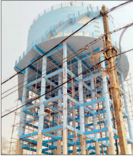
हरिभूमि न्यूज | मिलाई

2 करोड़ 17 लाख 48 हजार 20 रुपए की लागत से इस ओवरहेड टंकी का निर्माण कराया गया था। योजना के तहत वार्ड 10, वार्ड 16 और वार्ड 17 के घरों तक नियमित पानी पहुंचाने का लक्ष्य रखा गया था। खासकर गर्मी के दिनों में लोगों को पानी की समस्या से राहत मिल सके। टंकी निर्माण के बाद इसे उसे पाइप लाइन नेटवर्क से जोड़ा गया। रविवार को चौथी बार पाइपलाइन कनेक्शन कर टेस्टिंग की गई लेकिन हर बार पाइपलाइन नेटवर्क से लीकेज नतीजा निराशाजनक रहा। टेस्टिंग के दौरान जगह-जगह पाइपलाइन से पानी का रिसाव सामने आया, जिससे पूरी व्यवस्था ठप हो गई। नूरी मस्जिद से लेकर निजामी चौक तक करीब 5 जगहों पर और भीम नगर में भी पाइप लाइन में लीकेज की समस्या पाई गई। स्थानीय रहवासियों का कहना है कि इतनी बड़ी राशि खर्च करने के बाद भी अगर पानी नहीं मिल रहा, तो यह सीधे तौर पर नगर निगम की लापरवाही है। लोगों ने जल्द से जल्द पानी सप्लाई शुरू करने की मांग की है।