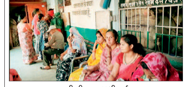
हरिभूमि न्यूज ►► मिलाई

अप्रैल महीने से पीडीएस हितग्राहियों को एक साथ तीन महीने का राशन दिया जा रहा है लेकिन सर्वर डाउन होने की समस्या कम नहीं हुई है। इस भीषण गर्मी में राशन लेने के लिए हितग्राहियों को घंटों इंतजार करना पड़ रहा है। यह स्थिति दुर्ग जिले में 656 पीडीएस राशन दुकानों की है। इन दुकानों में 4990 लाख हितग्राहियों को राशन लेने के लिए भीषण गर्मी में जूझना पड़ रहा है।