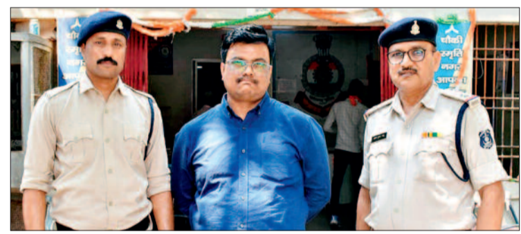
हरिभूमि न्यूज ►► मिलाई

जुनवानी सूर्यामॉल में संचालित लिस्टोमेनिया किचन एंड क्लब में लंबे समय से अवैध बिजली के चोरी का शिकायत मिल रही है, लेकिन गिने चुने लोगों पर ही कार्रवाई की जा रही है। बड़े तस्करी पुलिस गिरफ्त से आज भी बाहर है। सूचना मिलने के बाद भी पुलिस गुमराह करती नजर आती है इसका बड़ा उदाहरण खुसीपार, दुर्ग, वैशालीनगर, छावनी समेत कई क्षेत्रों ने बखौफ तरीके से तस्करी हो रही है।